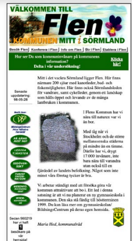
Flen.se år 1998