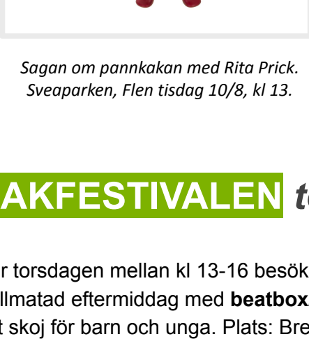
Sagan om pannkakan med Rita Prick. Sveaparken, Flen tisdag 10/8, kl 13.