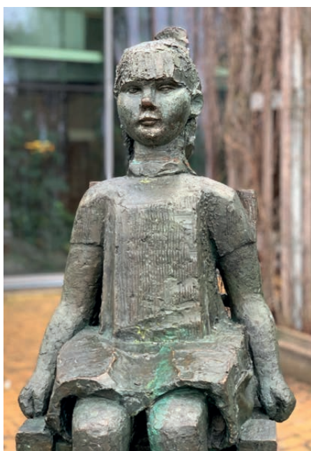
Den mexikanska stolen av Gunnel Friberg