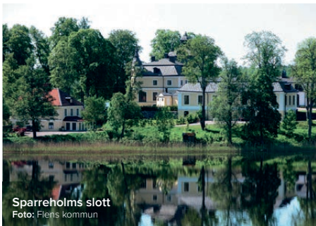
Sparreholms slott

Cykel- och vandringslederna i Flen passerar ofta förbi sevärdheter som Stenhammar Slott, ett typiskt sörmländskt herrgårdslandskap där kungen huserar. Strax utanför Mellösa ligger statsministerresidenset Harpsund. Här kan man promenera i omgivningen strax utanför parken. Sparreholms slott, Hedenlunda slott och Rockelstad slott är väl värda ett besök. Upplev fantastisk kulturmiljö, god mat, fint boende, museer och möjlighet till slottsbad och aktiviteter.