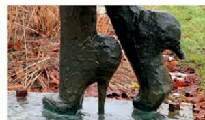
Detalj från skulpturen "Tonåring" av Ingela Hietman.

Adressen Förskolan 3 642 31 Flen 0151410225 kultur@edu.flen.se